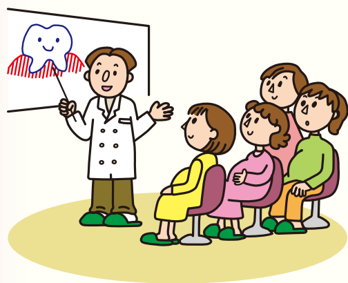
妊婦歯科健診受診の有無とその子どものむし歯保有数