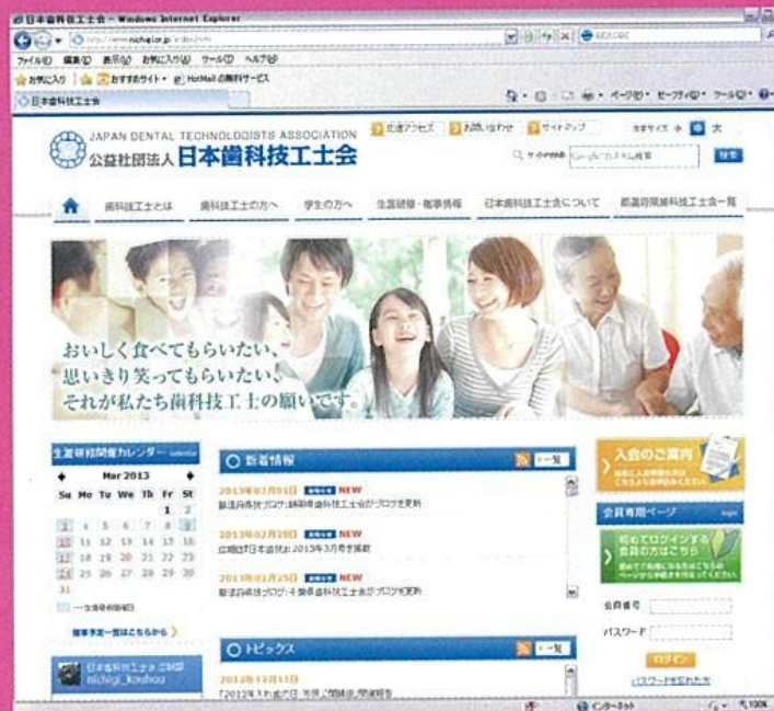
公益社団法人日本歯科技工士会ホームページ

2005年（平成17年）、天皇皇后両陛下御臨席のもと、創立50周年記念大会が盛大に開催されました。